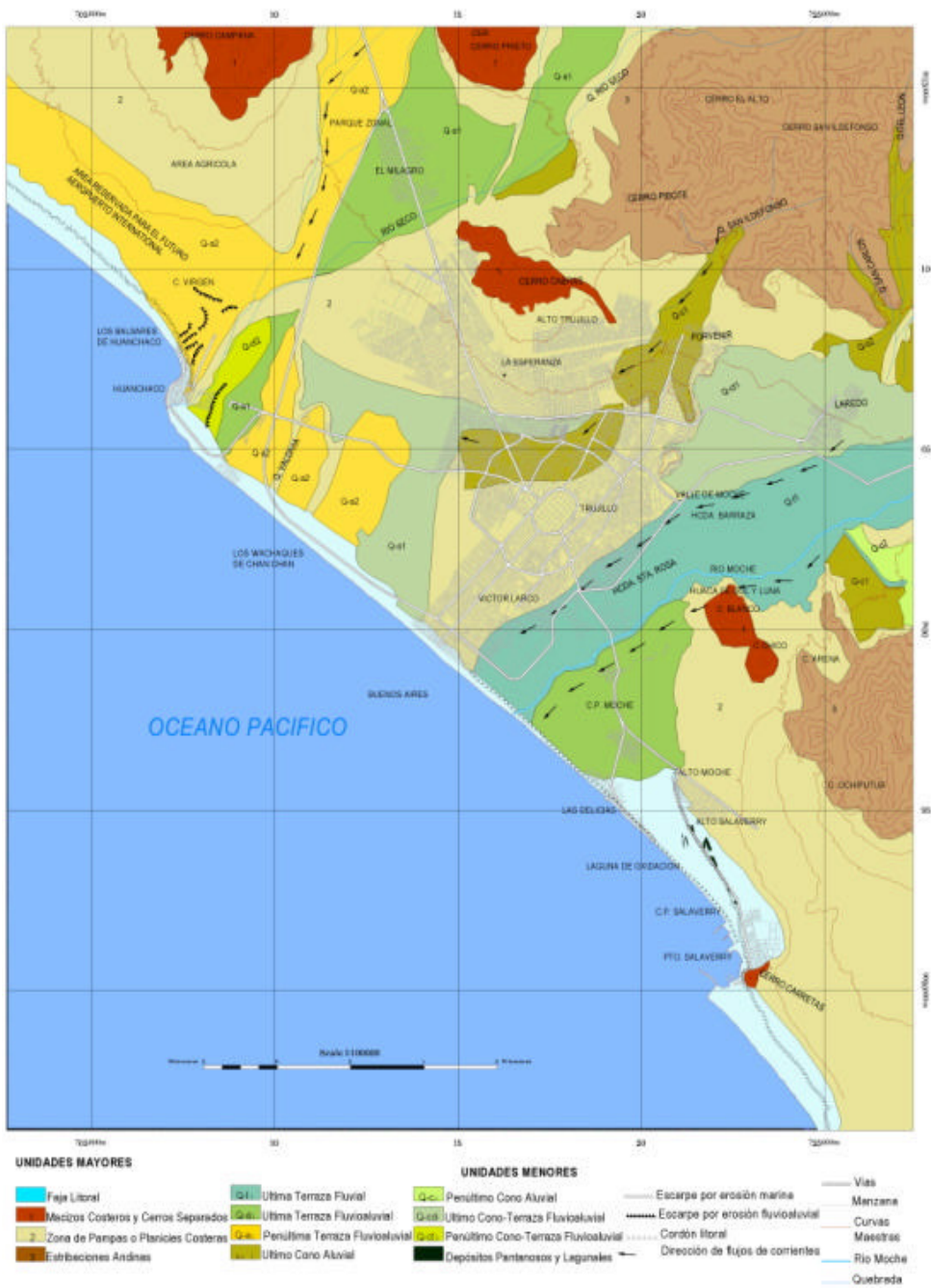
Fig. 1. Mapa geomorfológico de la provincia de Trujillo, Perú