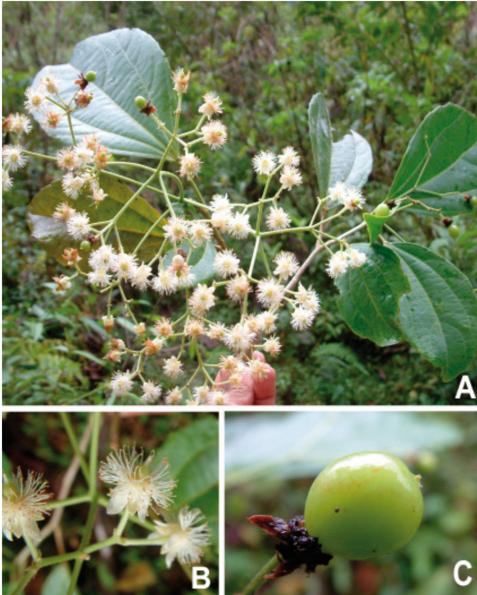
Fig. 2 Hasseltia yanachagaensis Vásquez & A. Monteagudo. A. Ramita florífera; B. Flor en antesis; C. Fruto inmaduro (A. Monteagudo et al. 15921, HOXA).