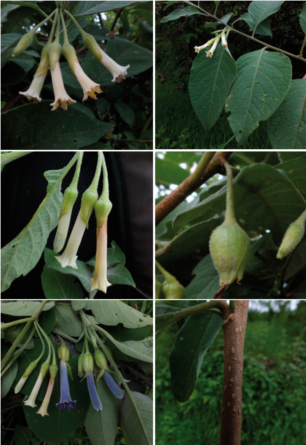
Fig. 2. Iochroma richardianthum S.Leiva. A-B-C. Rama floríferas; D. Fruto; E. Iochroma richardianum e Iochroma cornifolium ; F. Tallo con lenticelas. Fotos: S. Leiva & J. Jara 5430, HAO