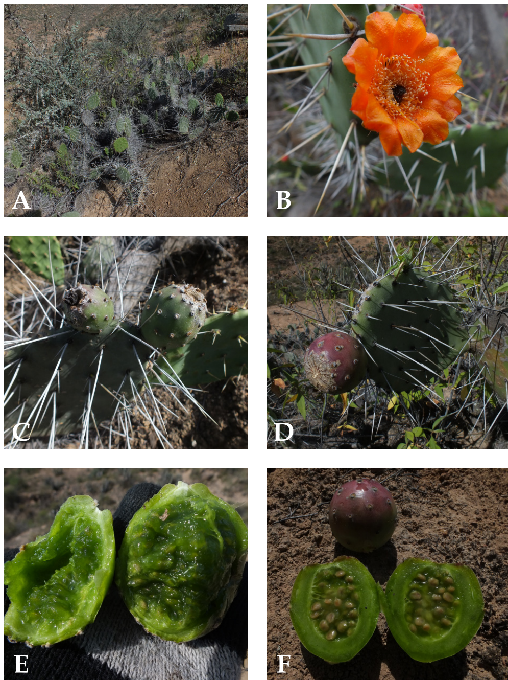
Fig. 2. Opuntia macbridei . A. Plantas en su hábitat; B. Flores amarillo-anaranjadas en antesis; C. Frutas inmaduras; D. Fruta madura; E. Fruta verde a la madures; F. Fruta madura y partida. (Fotos cortesía: S. Leiva, HAO).