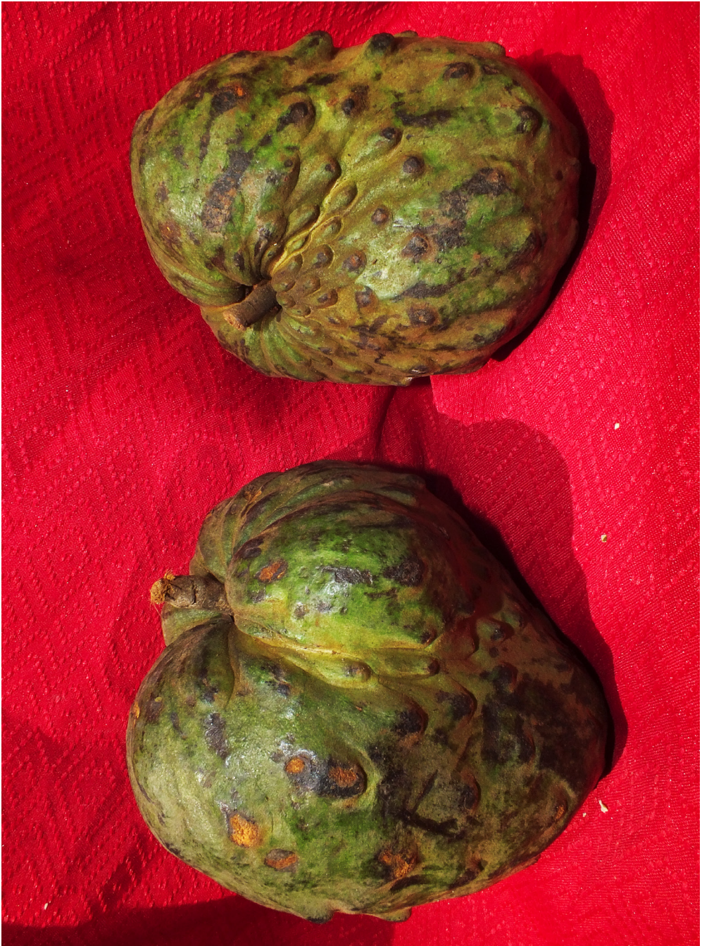
Fig. 3. Annona cherimola Mill. Frutas.