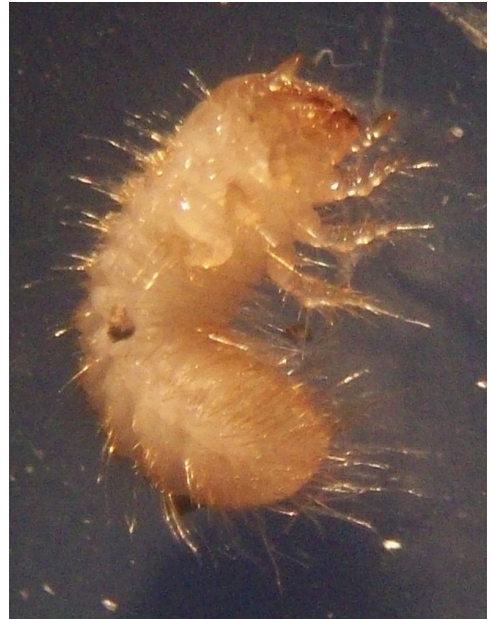
Fig. 2. Vista lateral de larva I recién eclosionada de Gymnetis bonplandii