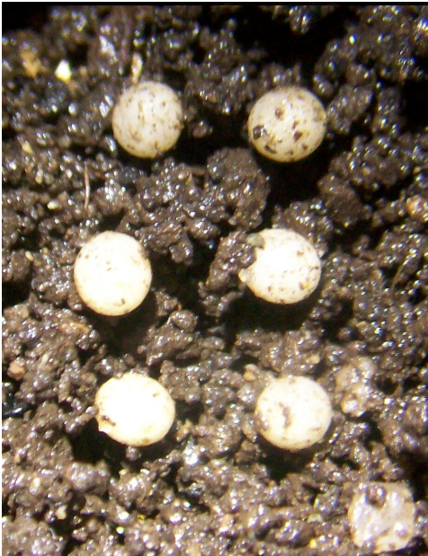
Fig. 1. Huevos aislados de Gymnetis bonplandii