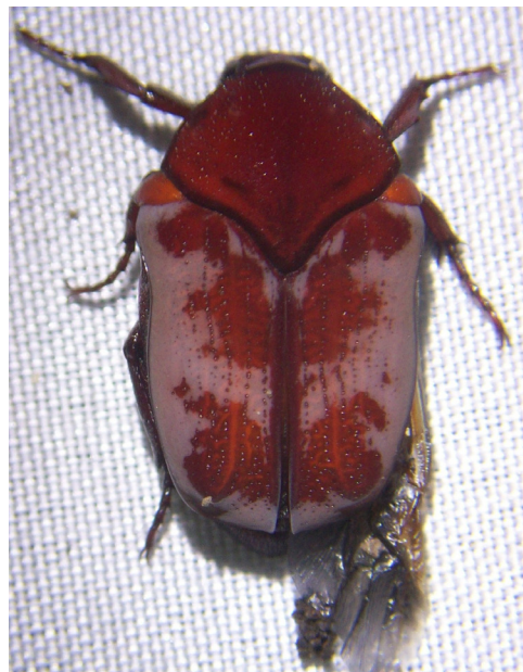
Fig. 7. Vista dorsal del adulto recién emergido de Gymnetis bonplandii