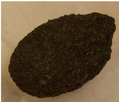
Fig. 6. Cámara pupal preparada por el tercer estadio larval con estiércol y tierra de Gymnetis bonplandii