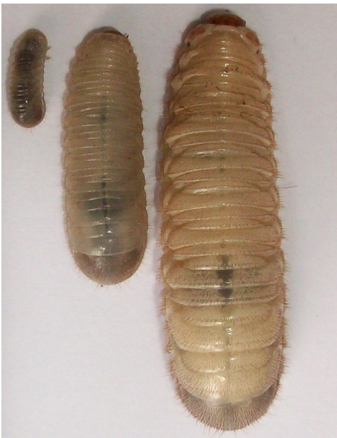
Fig. 3. Vista dorsal del primer, segundo y tercer estadio larval de Gymnetis bonplandii