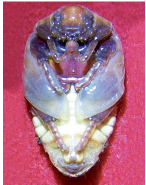
Fig. 4. Vista ventral de la pupa de Gymnetis bonplandii