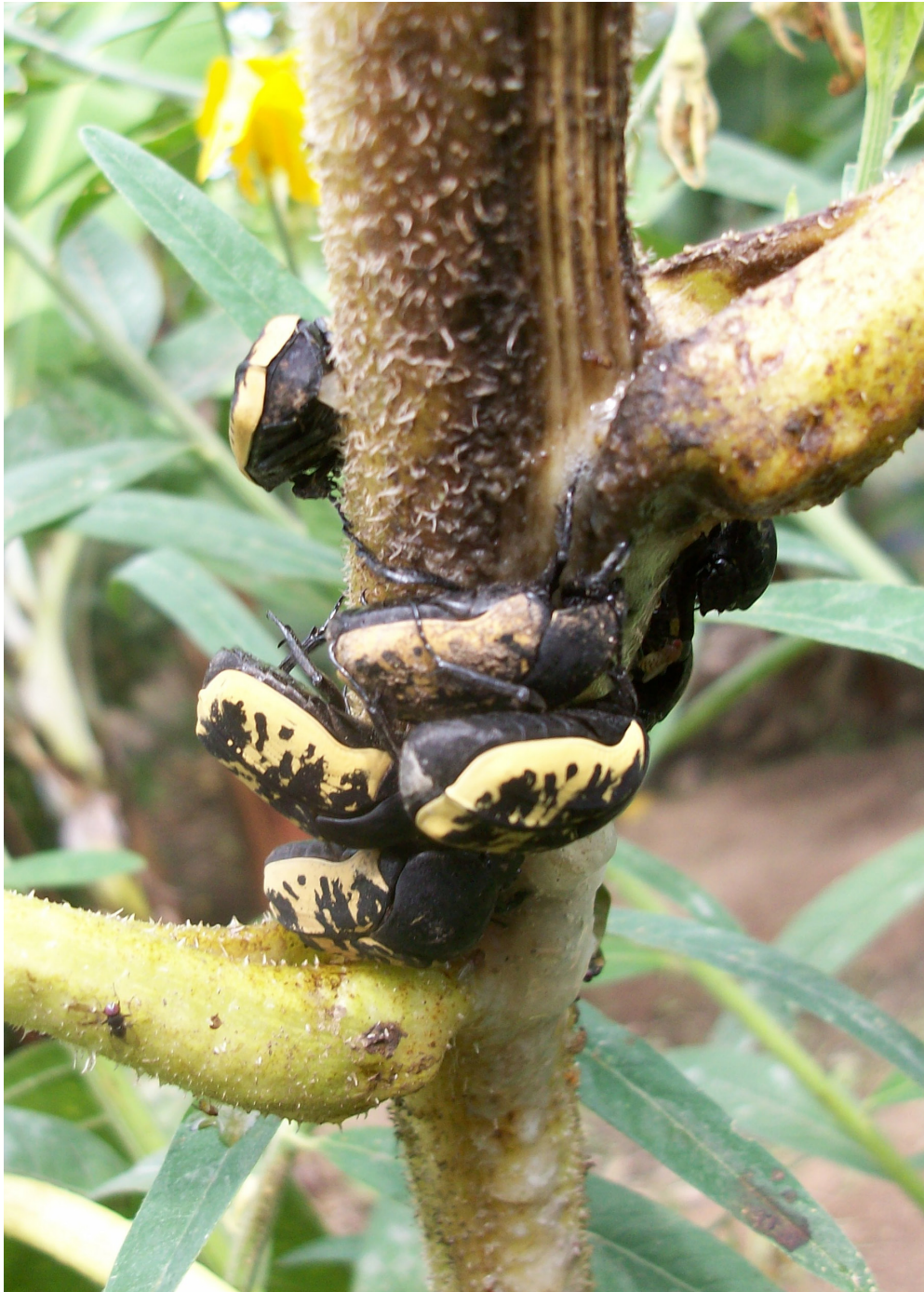
Fig. 10. Adultos de Gymnetis bonplandii alimentándose de secreciones de girasol en el campo