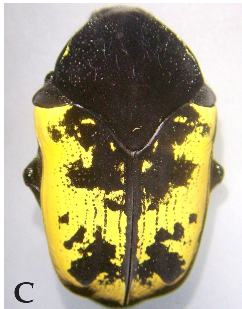
Fig. 9. A,B,C.Vista dorsal de tres adultos. Nótese las variaciones de las manchas oscuras en el dorso de Gymnetis bonplandii