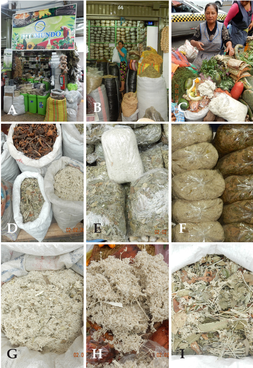
Fig. 2. Iresine weberbaueri Suss. "flor blanca". A-C. Lugares de comercialización como planta medicinal en la ciudad de Lima, Perú; D-F. Presentación del producto para la venta; G-I. Venta del producto: G-H. En forma pura, I. Combinada con otras plantas medicinales.