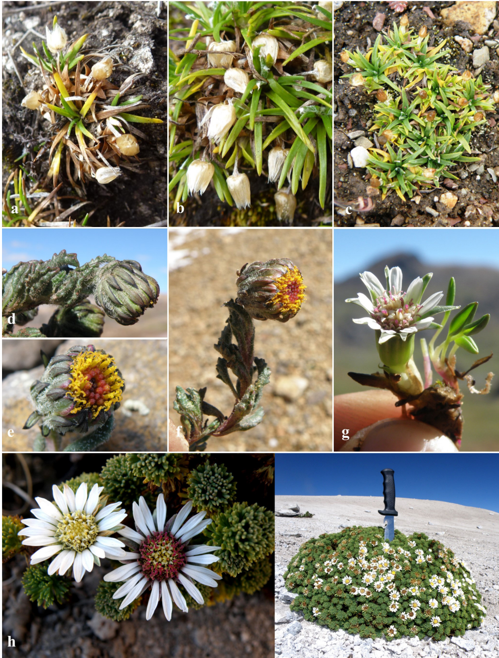
Fig. 1. Nuevos registros de Asteraceae. (a–b) Hábito de Jalcophila boliviensis Anderb. & S. E. Freire; (c) Hábito de Jalcophila ecuadorensis M. O. Dillon & Sagást.; (d–f) Rama florífera de Senecio aquilaris Cabrera; (g) Werneria spathulata Wedd., (h) Rama florífera y (i) hábito de Xenophyllum pseudodigitatum (Rockh.).