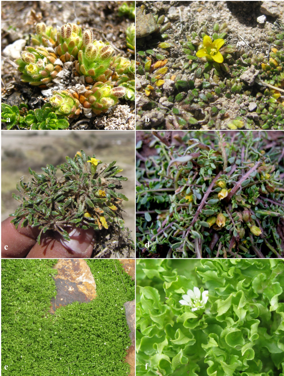
Fig. 2. Nuevos registros de Brassicaceae y Caryophyllaceae. (a) Hábito de Draba loyzana Al-Shehbaz; (b–c) Hábito de Petroravenia werdermannii (O. E. Schulz) Al-Shehbaz; (d) Hábito de Rorippa beckii Al-Shehbaz; (e) Hábito y (f) Rama florífera de Stellaria weddellii Pedersen.