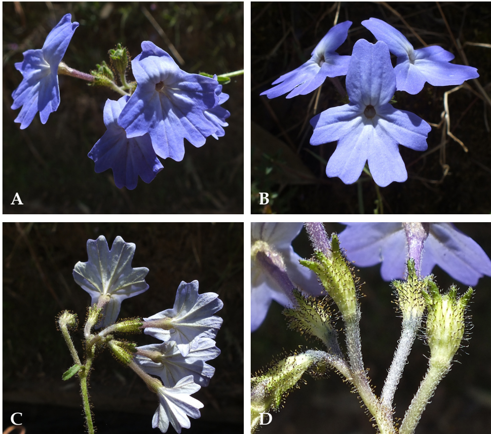
Fig. 2. Browallia termophylla S. Leiva, Tantalean & Peláez. A. Rama florífera; B. Flor en antésis; C. Flor en antésis en vista externa; D. Cápsula. (Fotografías de S. Leiva, T. Mione & L. Yacher 5872, HAO).