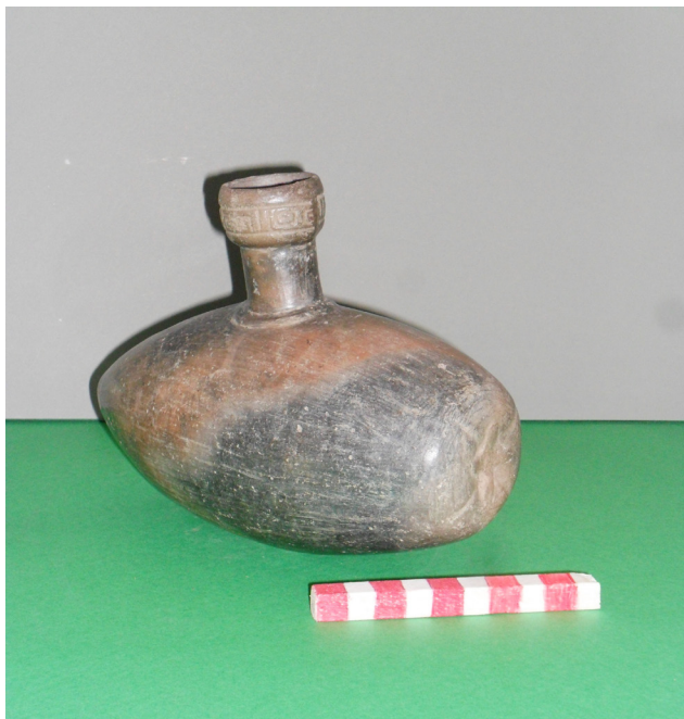
Fig. 3. Ceramio representando “papaya”. Cultura Chimú, 900-1470 d. C. Colección MHNC-UPAO, C-0040.