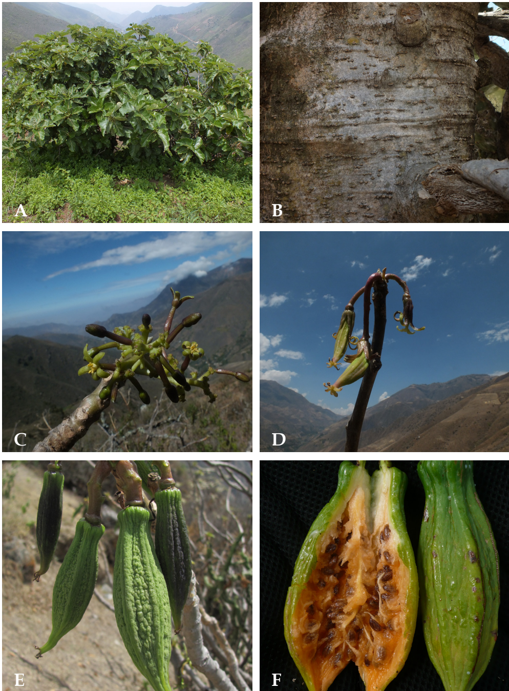
Fig. 2. Carica candicans A. Gray. A. Planta; B. Tallo; C. Flores masculinas; D. Flores femeninas; E. Frutas verdes; F. Frutas maduras.