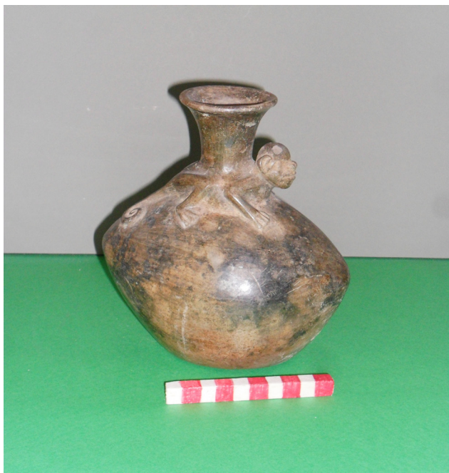
Fig. 4. Ceramio con representación de “papaya” y “mono”. Cultura Chimú, 900-1470 d. C. Colección MHNC-UPAO, C-0027.