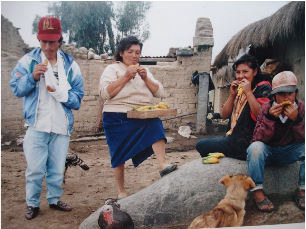
Fig. 5. Familia comiendo Carica candicans .