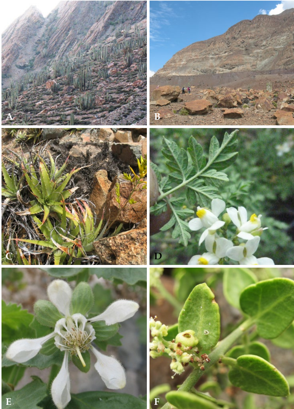
Fig. 3. A y B. Paisaje de Reserva en la parte baja dominada por cactáceas; C. Deuterocohnia longipetala ; D. Cardiospermum corindum ; E. Presliophytum heucheraefolium ; F. Cryptocarpus pyriformis .