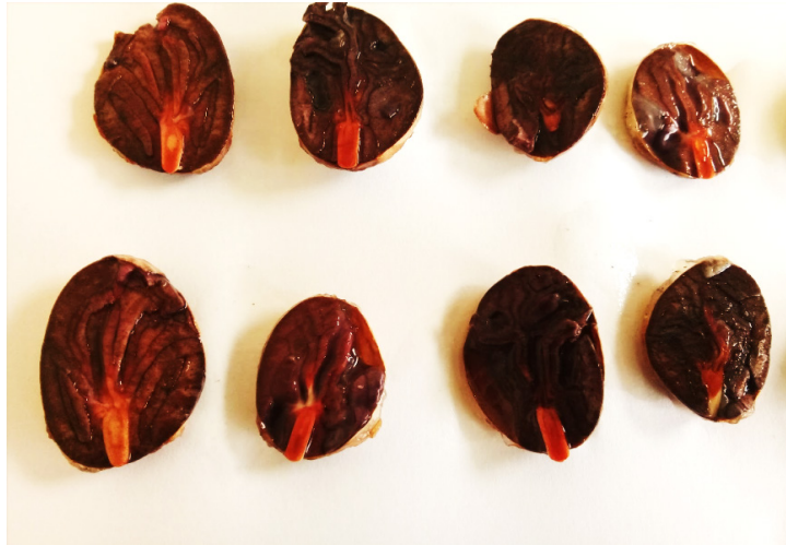
Fig. 2. Semillas viables de elevado vigor de T. cacao L., en el 1 er día de evaluación con 2, 3,5 -Trifeniltetrazolio