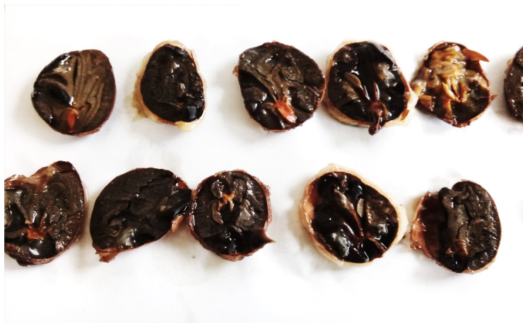
Fig. 3. . Semillas inviables de T. cacao L., en el 6to día de evaluación con 2, 3,5 - Trifeniltetrazolio