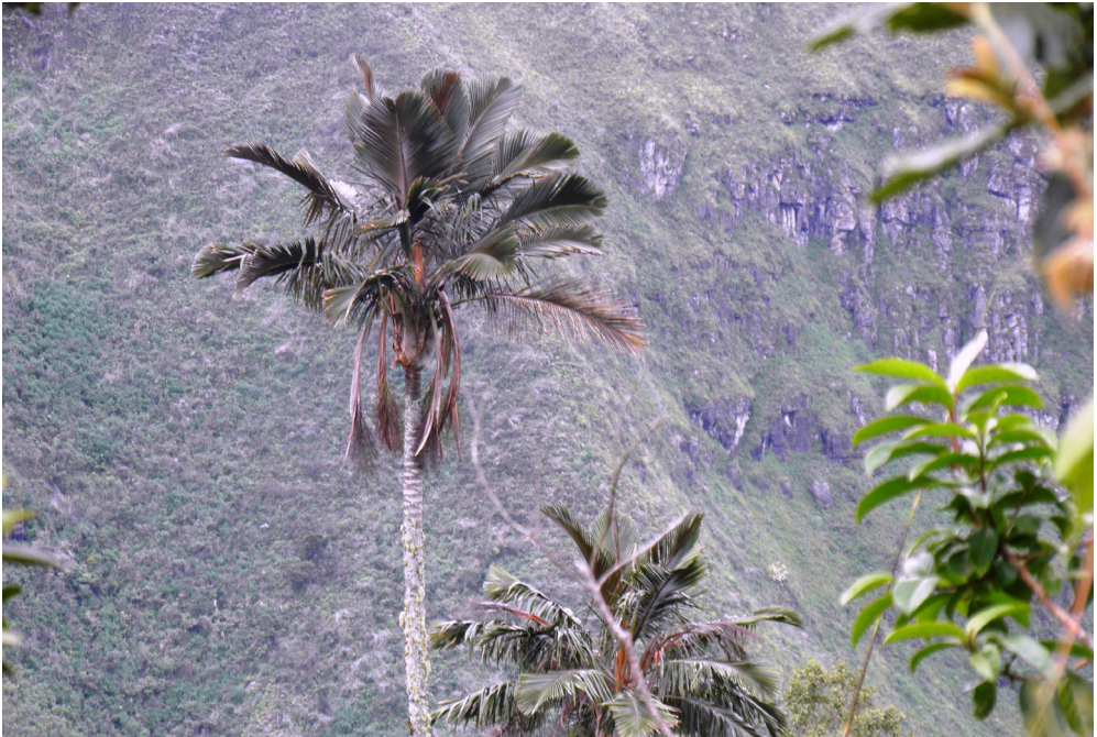
Fig. 6. Individuos adultos de Ceroxylon parvifrons