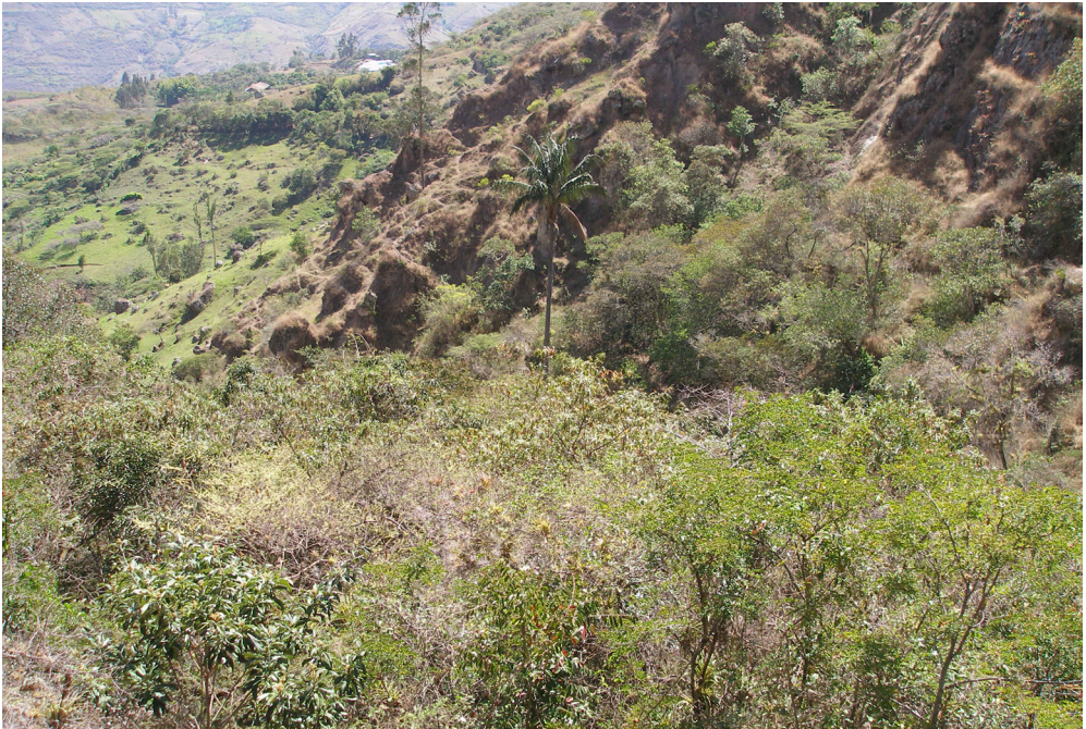
Fig. 2. Bosque estacionalmente seco en Litañ- Pulán- Santa Cruz con presencia de Ceroxylon quindiuense .