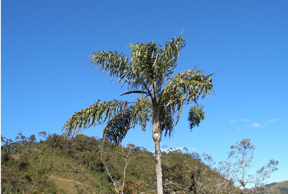
Fig. 8. Individuo de Ceroxylon vogelianum .