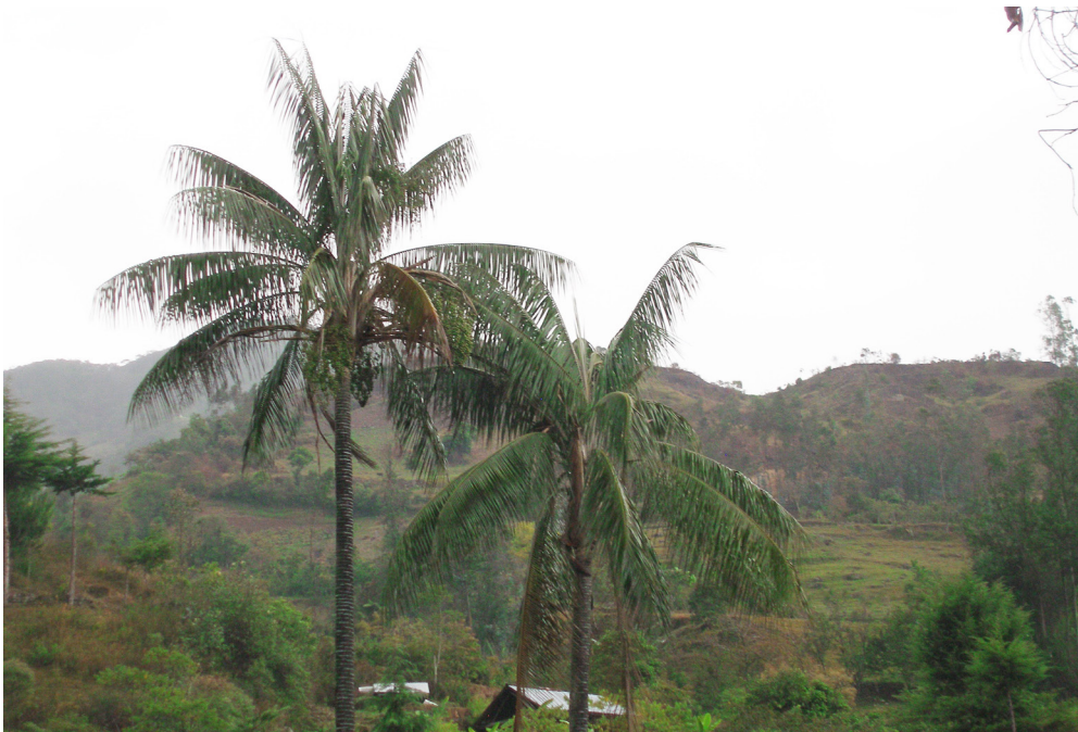
Fig. 5. Individuo adulto de Ceroxylon quindiuense .