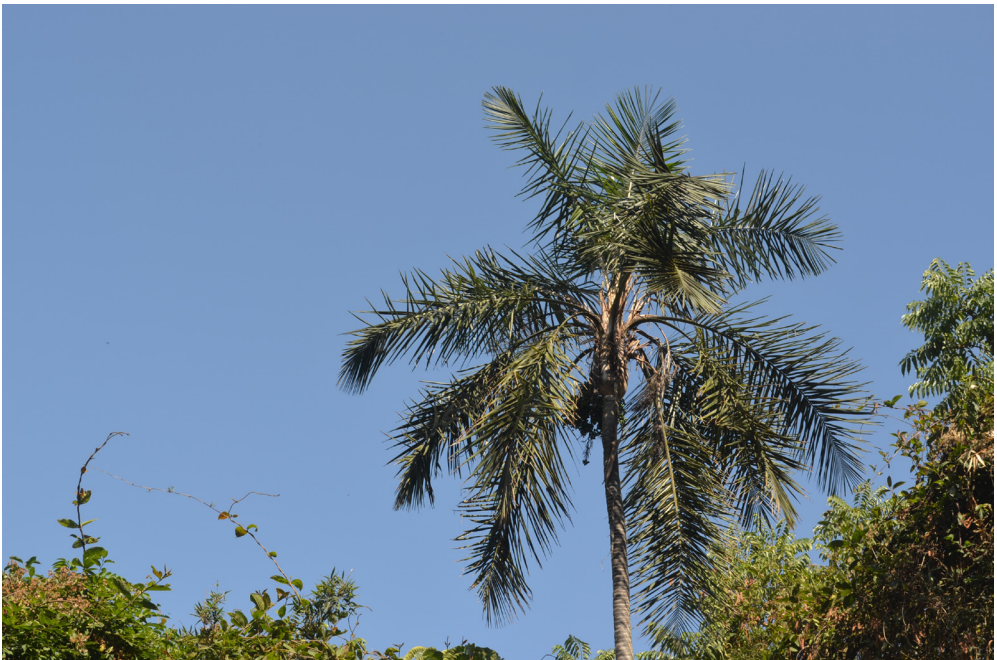
Fig. 7. Individuo de Ceroxylon parvum en Monteseco.