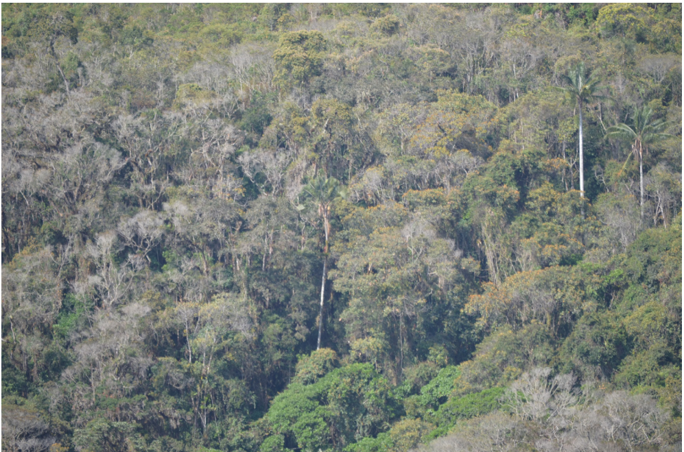
Fig. 3. Bosque nublado seco de la vertiente occidental; La Libertad, Catache, Santa Cruz con presencia de Ceroxylon quindiuense .