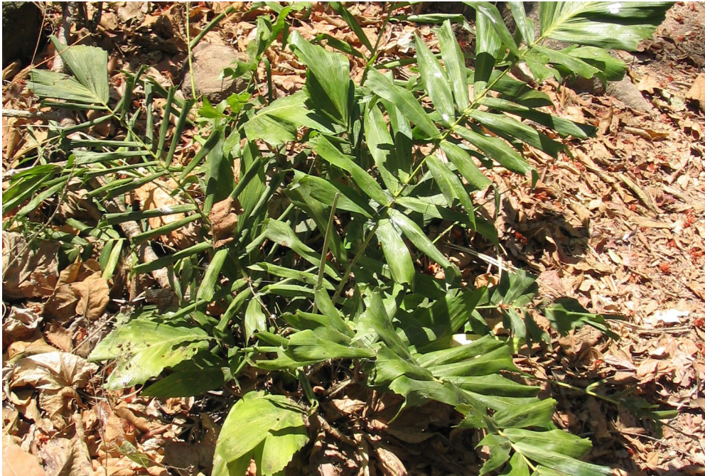
Fig. 4. Individuo juvenil de Aiphanes eggertii