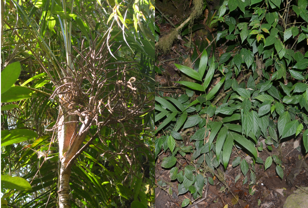
Fig. 9. Individuo adulto (izq.) y plántula de Geonoma undata (der.).