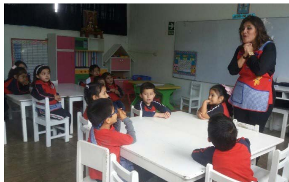
La profesora y los niños en el desarrollo de una clase sobre educación emocional

tablas de frecuencias y porcentajes (nivel de ambas variables); prueba de normalidad de Shapiro-Wilk, cuyos resultados permitieron seleccionar el uso de la prueba no paramétrica de correlación de Spearman para determinar la relación entre las variables habilidades emocionales y desarrollo integral.