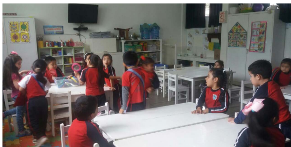
Los pequeños alumnos aplican el desarrollo de las habilidades emocionales.

promoviendo así, la "empatía" (cooperación), de automotivarse para ir aprendiendo cada día más e ir asumiendo retos que le permitan fortalecer sus aprendizajes y lograr desarrollar un trabajo cooperativo que le sea significativo incluso en su vida adulta (participación).