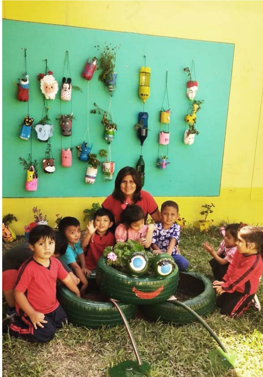
I.E.I. 1603 "Tesoritos de Jesús", Puerto de Malabrigo