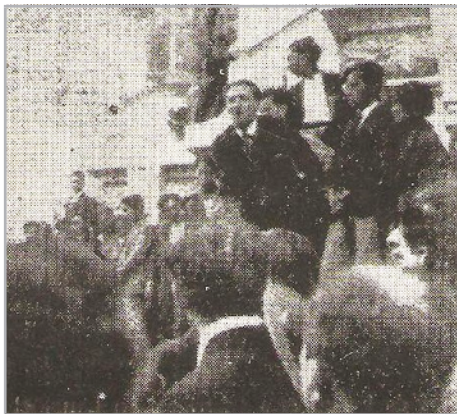
Haya de la Torre pronuncia su discurso en el sepelio de las víctimas del 23 de mayo. "¡El quinto, no matar!", repitió tres veces, en alusión al quinto mandamiento del cristianismo.

veces: "El quinto no matar..." 4 . Ese mismo día, el arzobispo, monseñor Emilio Lissón Chávez, emitió un decreto mediante el cual canceló la pretendida consagración.