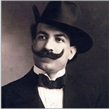
Alfredo L. Palacios, académico y político argentino.

y generosa de la juventud, sedimentos amargos de discordia, fuente germinadora de futuros y perdurables enconos 49 . Palacios había visitado nuestro país el año de 1919; en Lima recibió cálidas manifestaciones de aprecio por parte de los estudiantes universitarios.