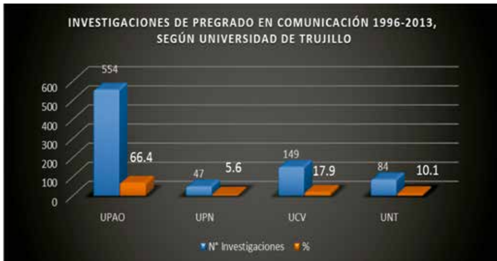
GRÁFICO N° 2