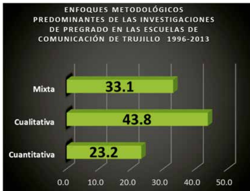
GRÁFICO N° 8