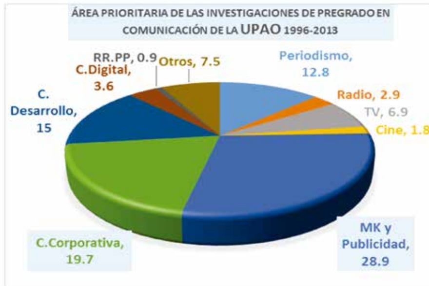
GRÁFICO N° 4