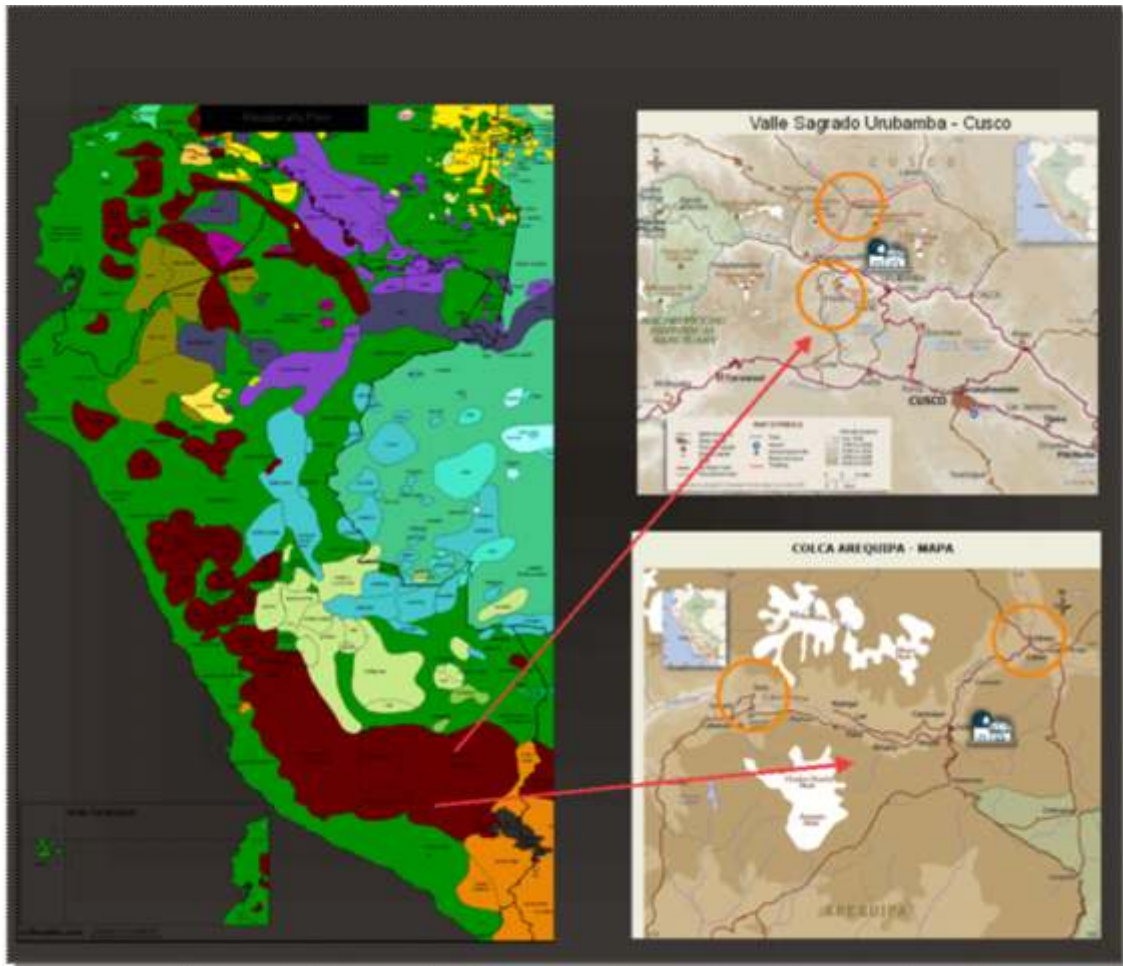
Mapa lingüístico y lugar de estudio.