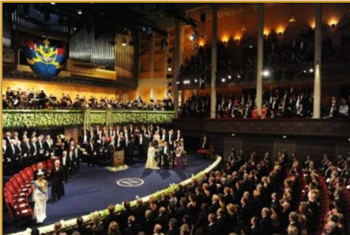
Vista lateral de la ceremonia de gala de entrega de los Premios Nobel 2010.