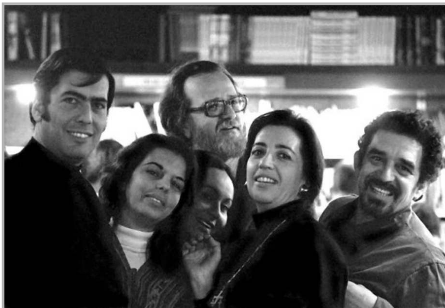
Mario Vargas Llosa, José Donoso, Gabriel García Márquez y sus respectivas esposas. Escritores del Boom latinoamericano.

Latina. Allí aprendí que el Perú era parte de una vasta comunidad a la que hermanaban la historia, la geografía, la problemática social y política, una cierta manera de ser y la sabrosa lengua en que hablaba y escribía. Y que en esos mismos años producía una literatura novedosa y pujante. Allí leí a Borges, a Octavio Paz, Cortázar, García Márquez, Fuentes, Cabrera Infante, Rulfo, Onetti, Carpentier, Edwards, Donoso y muchos otros, cuyos escritos estaban revolucionando la narrativa en lengua española y gracias a los cuales Europa y buena parte del mundo descubrían que América Latina no era sólo el continente de los golpes de Estado, los caudillos de opereta, los guerrilleros barbudos y las maracas del mambo y el chachachá, sino también ideas, formas artísticas y fantasías literarias que trascendían lo pintoresco y hablaban un lenguaje universal.