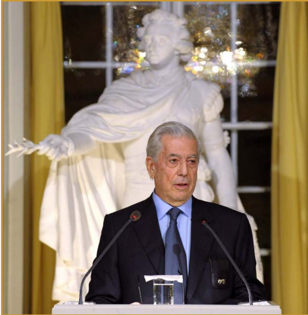
Discurso en la Academia Sueca, acto previo a la recepción del Premio Nobel de Literatura 2010.