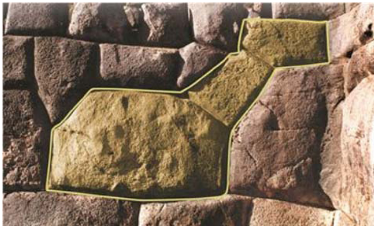
Figura 3. Illa diseñada con tres piedras.

dentro de Ollantaytambo y Machu Pikchu; en este caso, si observamos cuidadosamente la construcción piramidal que está al lado de la plaza principal de Machu Pikchu, veremos que esta pirámide tiene la forma de una gigantesca illa (Fig. 4).