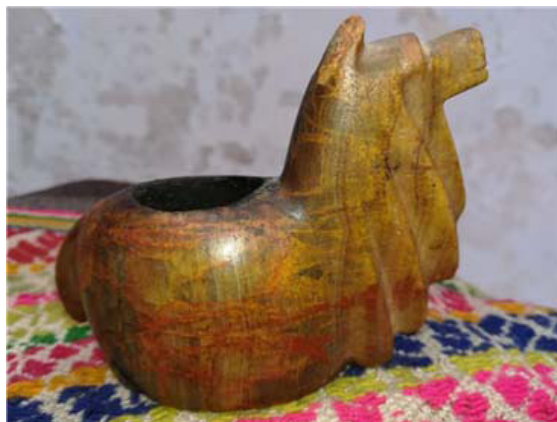
Figura 1. Illa pétrea representando a una alpaca.

En muchos de nuestros museos se encuentran estatuillas rituales pétreas con figuras de llamas y alpacas sentadas, carentes de una explicación del uso de ellas; se las conocen como illas (Fig. 1).