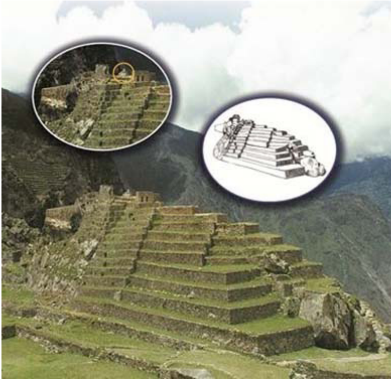
Figura 4. Esta illa está coronada por un altar muy importante (observe su ubicación dentro del círculo amarillo).

es erradamente interpretado como un reloj solar o intiwatana .