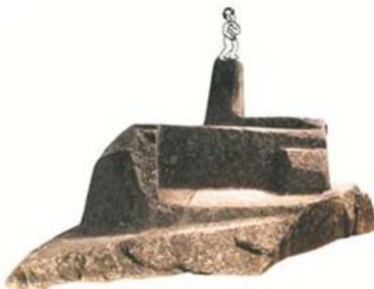
Figura 7. Seg n Guaman Poma de Aiala, se colocaba un  dolo de un personaje desnudo sobre la columna del ushnu.

Poma de Aiala en su gr fico sobre el sembr o (Fig. 8).