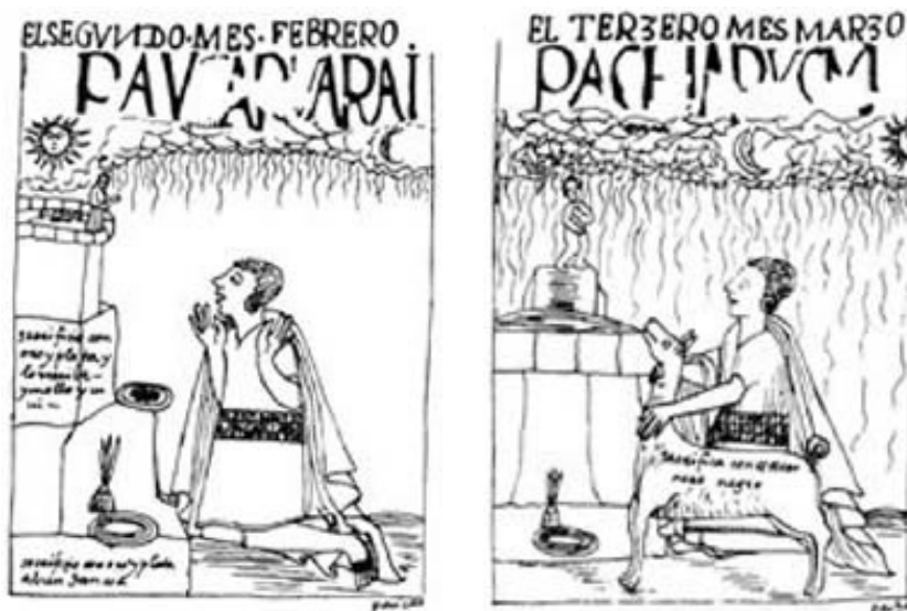
Figuras 5 y 6. Los dibujos de Guaman Poma de Aiala se asemejan mucho a la forma del ushnu p treo de Machu Pikchu, llamado hoy erradamente intiwatana .