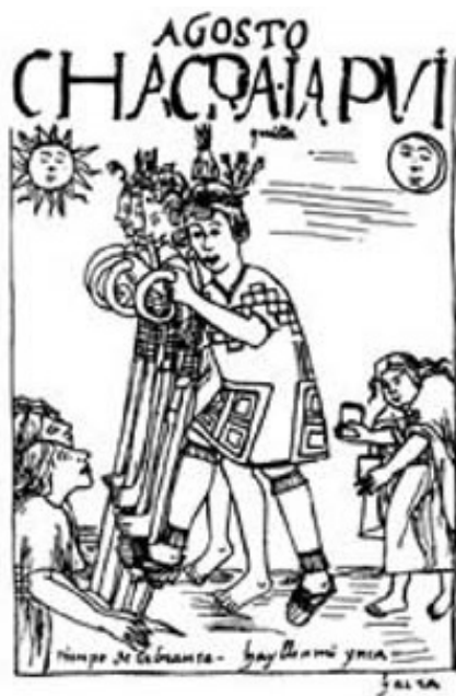
Figura 8. Los varones usan su chakitaqlla (arado de pie) para abrir la tierra como simbolismo de una conexión sexual entre lo masculino y lo femenino, mientras la mujer coloca las semillas, porque es como si ella pusiera los huevos de sus ovarios dentro de la tierra; esto nos permite entender la relación de la mujer con la tierra como símbolo de fertilidad y su conexión con la Pachamama.