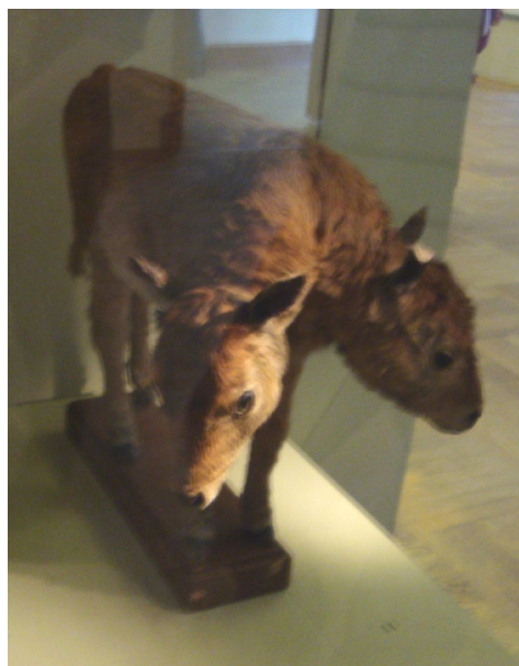
Figura 2. Reconstrucción actual de la Kunst-kammer en San Petersburgo con una de las muestras del anatomista holandés Frederik Ruysch: una vaca con dos cabezas.

Los objetos artificiales hechos a mano con extraordinarias representaciones de las cosas naturales; las obras de arte logradas con elevada técnica que permite que el fabricante produzca lo imposible, como la talla de una nuez con la escena de la Última Cena; o pinturas y grabados particularmente realistas con materiales exóticos, como el marfil, el nácar, el cuerno de rinoceronte y otros materiales; o también objetos de tecnología instrumental de gran precisión, como son los