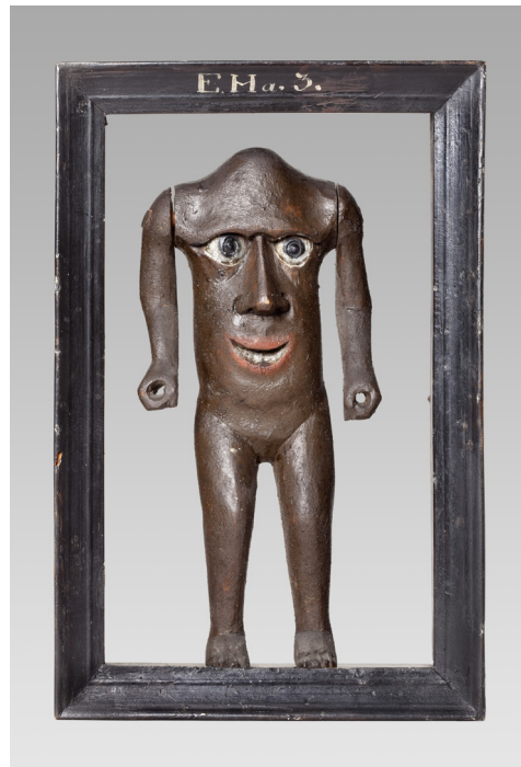
Figura 1. Esta figura de un acéfalo llamado Atabaliba llegó a la Kunstkammer Real Danesa antes del año 1690.

Así pues, el gusto por adquirir objetos completamente anormales de formas raras y extravagantes, como inusualmente grandes o excepcionalmente pequeños, fue un invento antiguo. La recolección de objetos raros, pero con curiosidad de