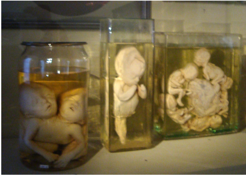
Figura 3. Reconstrucción actual de la Kunstammer en San Petersburgo con muestras del anatomista holandés Frederik Ruysch: niños monstruosos.