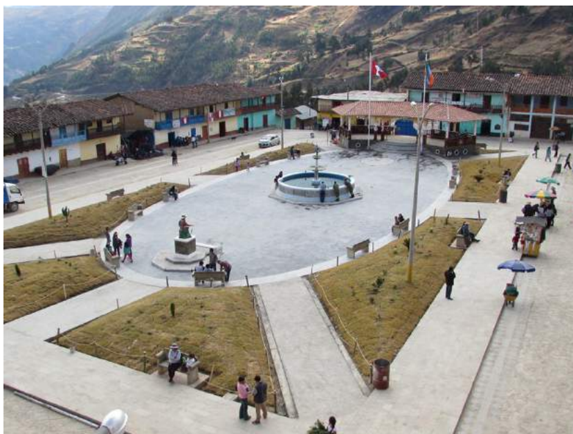
Figura 3. Plaza principal de Taucá luego de la remodelación.