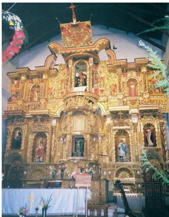
Figura 6. Retablo mayor de la iglesia de Tauca.

El retablo mayor, recubierto de pan de oro, tiene una configuración particular en su diseño, ya que no sigue la cuadrícula típica de dos cuerpos y tres calles que tienen otros retablos; en este caso, no hay continuidad en las columnas para delimitar las calles (Figs. 6 y 7). En el primer cuerpo se tienen cuatro hornacinas, dos a cada lado del tabernáculo ubicado en la calle central, todas ellas separadas por columnas salomónicas. El tabernáculo sobresale convexo. Sobre este se abren arcos de cornisa y sobre ellos sobresale la hornacina central del segundo cuerpo que aloja la escultura