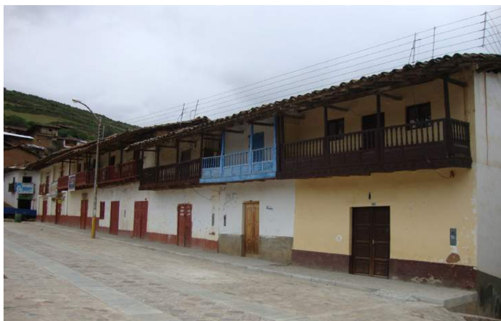
Figura 2. Balcones que dan frente a la plaza principal de Tauca.