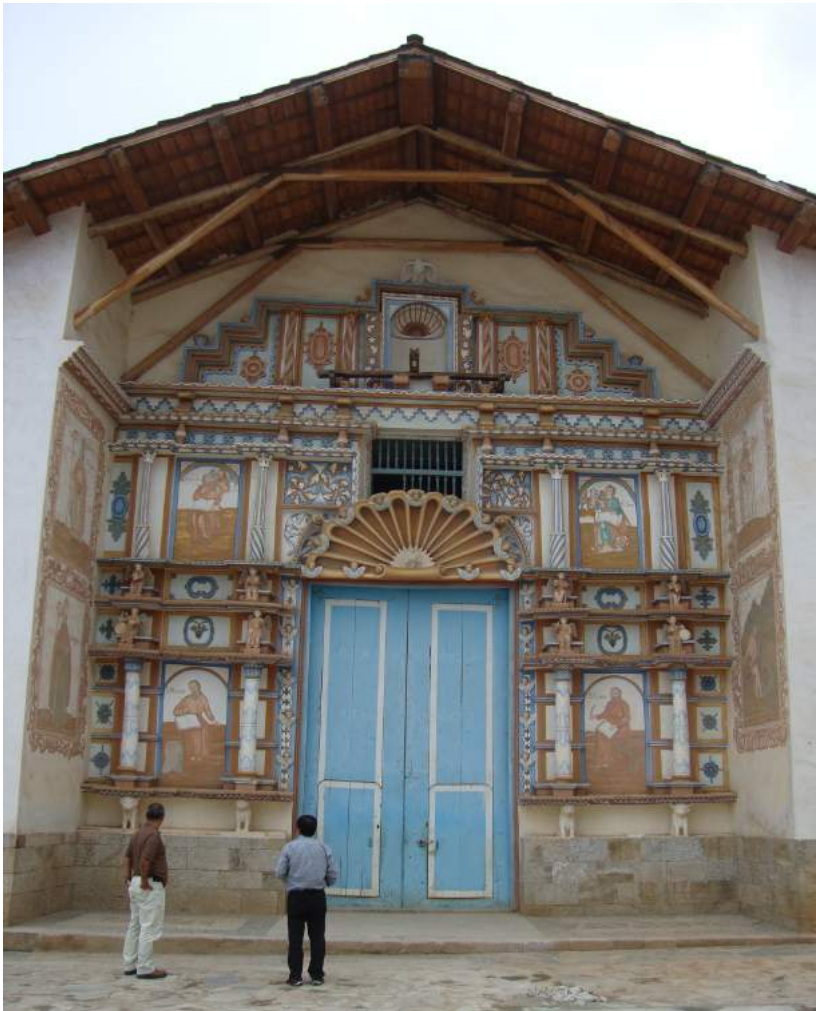
Figura 5. Fachada y portada retablo de la iglesia de Tauca. Se simulan hornacinas con las pinturas de los cuatro evangelistas.

En su fachada, enmarcada por los gruesos muros laterales de adobe, destaca la colorida portada retablo, donde se entremezclan con espontaneidad y expresividad los elementos estructurales ornamentales (columnas y cornisas) y pintura mural de iconografía religiosa y diseños barrocos. En el caso de algunos motivos pictóricos, con la restauración antes mencionada, se les ha cambiado de color, aunque aún alternando dentro de la gama de rojos y azules original. Sobre el zócalo se hallan cuatro pequeñas esculturas de toros y leones. En alineación con estos, parten cuatro filas de pequeñas columnas de madera pintada que definen las tres calles de la portada retablo. En las calles laterales, en lugar de hornacinas se han pintado las imágenes de los cuatro evangelistas, san Marcos y san Lucas en el primer cuerpo, y san Mateo y san Juan en el cuerpo superior. Sobre el vano de la puerta se ubica una venera rodeada de querubines y con la imagen del Espíritu Santo como paloma en el centro. El primer