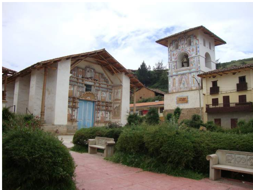
Figura 4. Iglesia de Santo Domingo de Taucá en la plaza principal (febrero 2016).