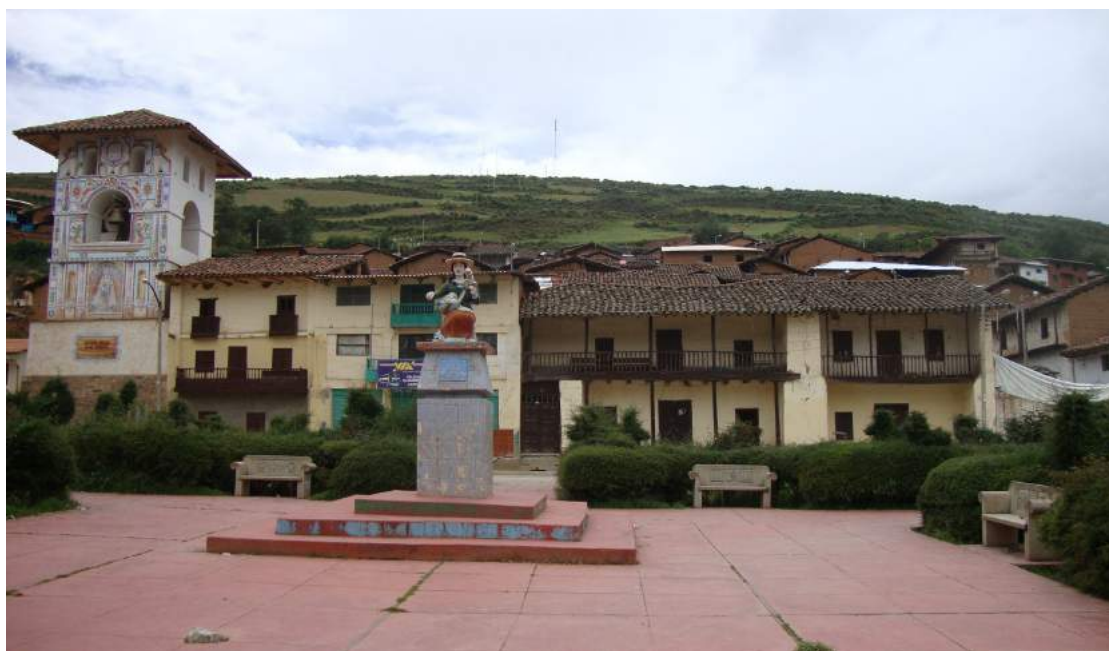
Figura 8. Campanario de la iglesia de Taucá y edificaciones alrededor de la plaza principal (febrero 2016).