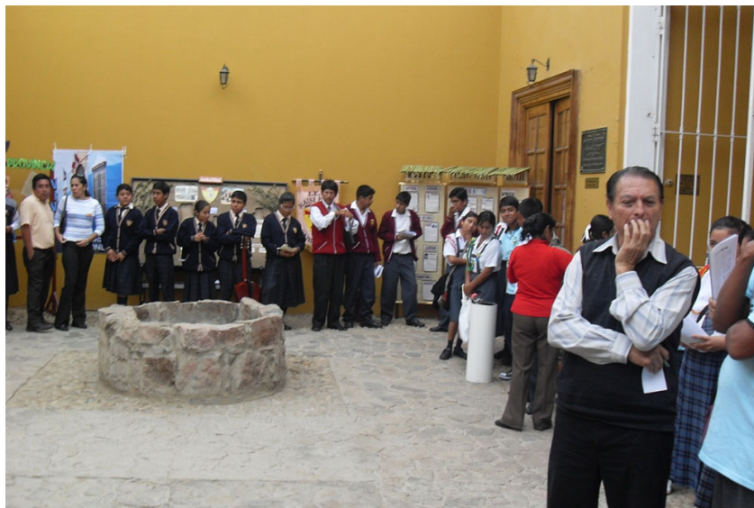
Figura 1. Estudiantes visitando la casa museo Antonio Raimondi, San Pedro de Lloc, provincia de Pacasmayo.

Es menester reconocer que los museos actuales en la ciudad se gestionan y manejan a manera de simples galerías, en las que solamente exhiben, pero no hacen docencia, investigación, ni conservación. La mayoría no investigan, por consiguiente, no tienen colecciones importantes que mostrar, que son los elementos que le dan valor patrimonial a la institución.