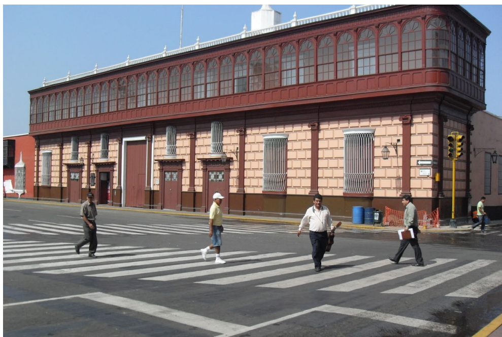
Figura 3. Exlocal del centro educativo Pedro Ureña en la plaza de Armas de Trujillo. En la actualidad declarado como Casa de la Identidad Regional, proyecto del Gobierno Regional de La Libertad.