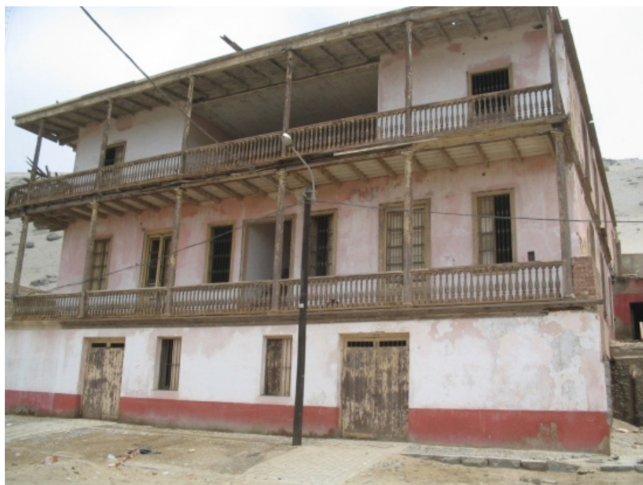
Figura 4. Casona Dalmau, declarada patrimonio cultural urbano, ubicada en el puerto de Salaverry.

Finalmente, se deben considerar propuestas de otras formas o corrientes museísticas, como los ecomuseos o los centros de interpretación (estaciones biológicas) para áreas naturales. Sobre este punto, cabe incidir en la necesidad de que el área de conservación privada Cerro Campana (Resolución Ministerial n° 192-2016-MINAM) cuente con un centro de interpretación, el mismo que interactúe con entidades que manejan el patrimonio cultural, considerando que en aquella área se desarrollaron también actividades de antiguas culturas prehispánicas.