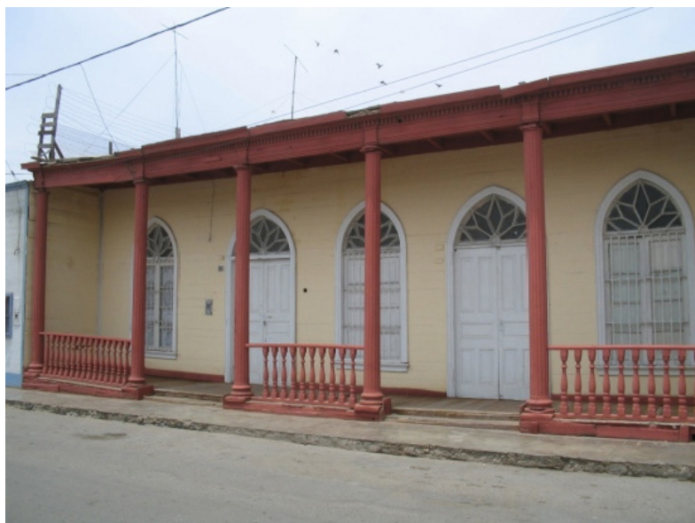
Figura 5. Casona patrimonio urbano en el puerto de Salaverry.