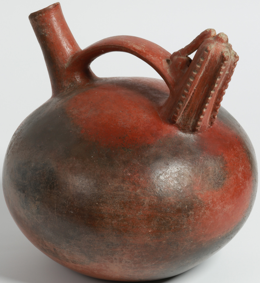
Botella con representación de cactus. Cultura Salinar, siglos V-III a. C.